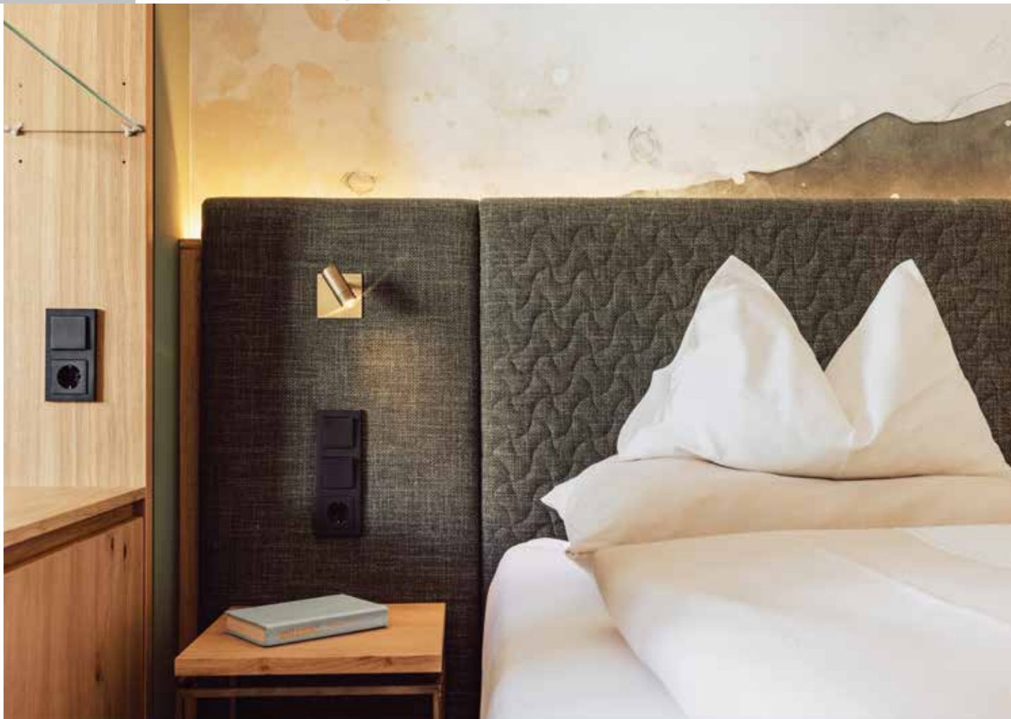
Echte Vollholzmöbel und Naturholzböden kombiniert mit warmen Farben sorgen für eine besonders wohnliche Atmosphäre.